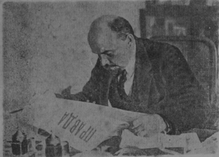
No es cosa de firmar, sino de saber hacer con éxito.

Durante aquellos caticos días (los primeros de la Revolución) sólo una voluntad y unos nervios de hierro podían resistir. Disciplina y orden rígidos eran evidentes en todos los departamentos. Lenin sabía en qué ocasiones había que proceder con rapidez y en cuáles había que ir poco a poco. Una vez llegó una delegación de obreros a proponer que nacionalizara la fábrica en que ellos trabajaban. ¿Pueden hacerlo? le preguntaron. "Sí, contestó Lenin, tomando una fórmula por llenar, es algo sencillo: de mi parte no tengo más que llenar esta fórmula y poner aquí abajo mi firma". Los obreros muy complacidos, exclamaron: "¡Muy